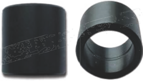
● IS (mit Innenschmierung)