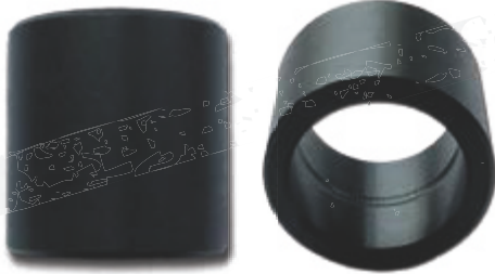
● IS (mit Innenschmierung)