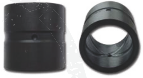
● AIS (mit Außen- und Innenschmierung)