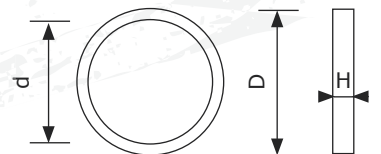
● Metallkäfig außen