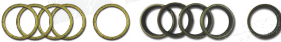
● Metallkäfig außen