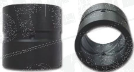
● AIS (mit Außen- und Innenschmierung)