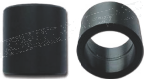
● IS (mit Innenschmierung)