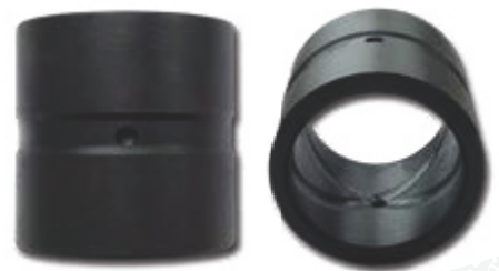
● AIS (mit Außen- und Innenschmierung)