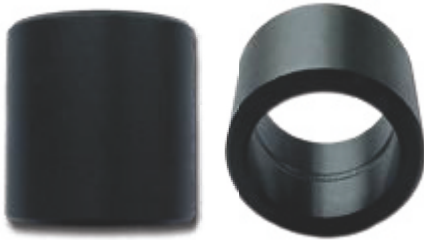
● IS (mit Innenschmierung)