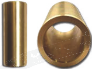
● Messing (ohne Schmierung)