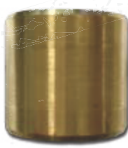
● IS Messing (mit Innenschmierung)