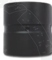
● AIS (mit Außen- und Innenschmierung)