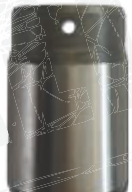
● IS Sonderbuche (mit Innenschmierung)