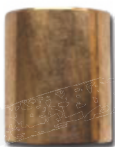
● Gleitlagerbuche WB (mit Schmieretaschen)