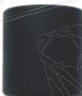
● OS (ohne Schmierung)