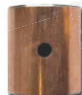
● Gleitlagerbuche WX (geschlitzt mit Bohrung und Kunststoffinnenbeschichtung)