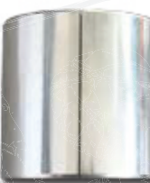
● Gleitlagerbuche WU (Glatt)