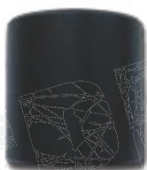
● IS (mit Innenschmierung)